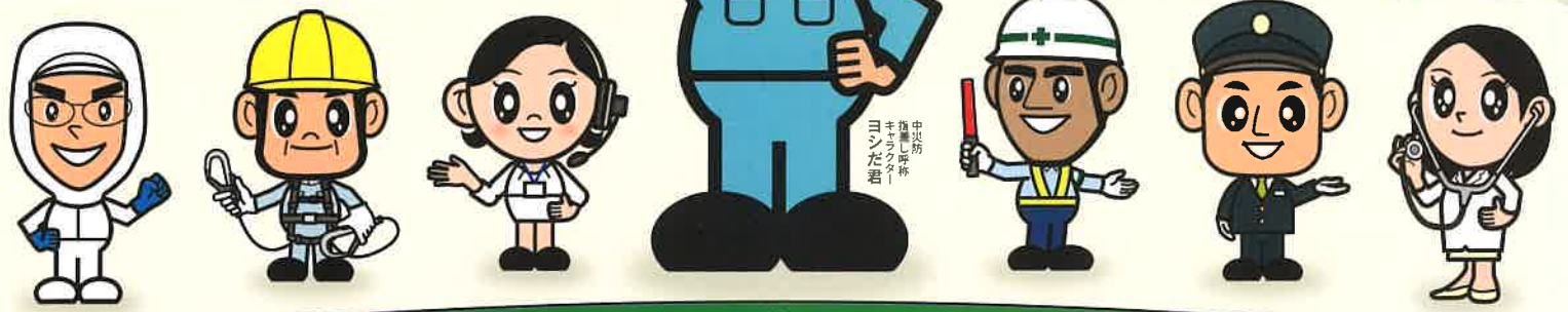
中災防 推進し海防 キョウシキ ヨシだ君