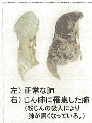
左) 正常な肺 右) じん肺に罹患した肺 (粉じんの吸入により肺が黒くなっている。)

現在、じん肺を治す根本的な治療がないため、じん肺にかからないための措置として、粉じんの発生源対策、局所排気装置等の適正な稼働、呼吸用保護具の適正な着用などにより、粉じんへの「ばく露防止対策」を徹底することが重要です。