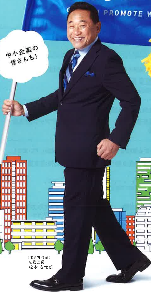
〈働き方改革〉 応援団長 松木 安太郎